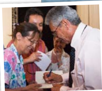
Disponible, Jean-Marie Périer s'est prêté au jeu des autographes.

Près de 600 personnes ont répondu à l'invitation de L'illustré pour sa première édition de Photos 08, le 27 juin à la Halle Sécheron, à Genève. Une soirée-événement: débats sur le photojournalisme, le rôle de l'image dans l'humanitaire, celui de la presse people, de nombreuses projections sur écran géant. Une première partie a été consacrée à une étude historique sur des photos d'archives, des années 10 aux années 40, puisées dans les collections des magazines par Gianni Haver, sociologue de l'image à l'Université de Lausanne. Cette projection a été suivie par le travail bouleversant de photographes suisses en mission pour le CICR. Elle s'est terminée par une avant-première de l'exposition que le Musée de l'Elysée consacrera fin 2009 au pionnier de la photographie suisse qu'a été Hans Steiner. Ensuite, les images légendaires d'un grand