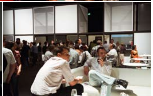
Entre débats et projections, le public avait le temps de souffler dans un décor très design.