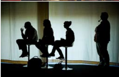
Ambiance ombres chinoises pour les spectateurs passionnés et amoureux de l'image.